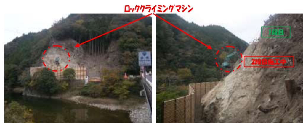
【大千瀬川下流錦橋より左岸側を望む】 【工事起点側(錦橋側)より終点側を望む】

進捗状況 引続き道路拡幅部分の法面掘削をロッククライミングマシン工法(RCM工法)にて行っています。掘削完了後は、仮設土留工の撤去を行います。