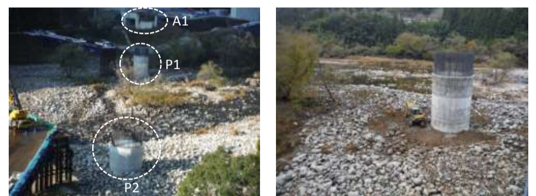
【終点(飯田)側から起点(浜松)側を望む】 【橋脚周り整地状況】

進捗状況 11月21日より、現場の準備作業を開始しています。また同日、浦川の柏古瀬地区に現場事務所が建ちました。ご近所の皆様、宜しくお願ひします。