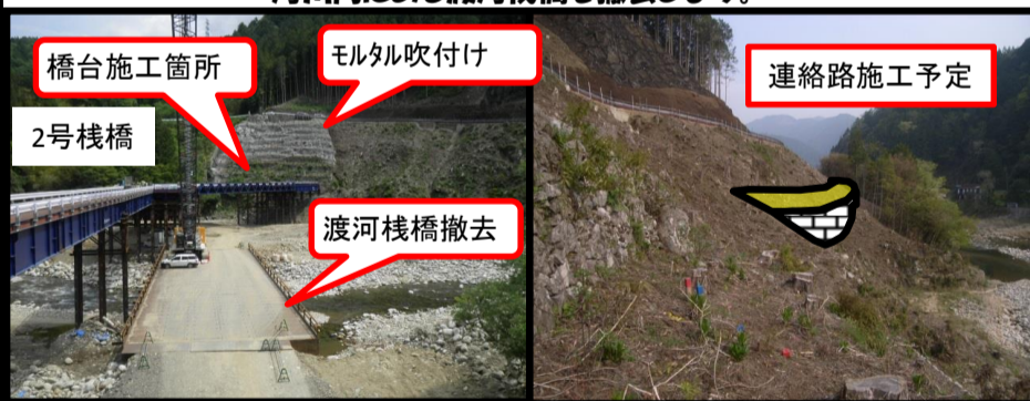
現場全景 大千瀬川対岸より撮影

現在大千瀬川を渡る2号栈橋が終わり橋台を掘削する準備の法面補強のモルタル吹付けを行っています。また、5月中旬に河川内にある渡河栈橋を撤去します。