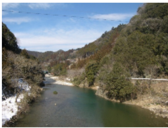
大千瀬川下流より左岸側を望む