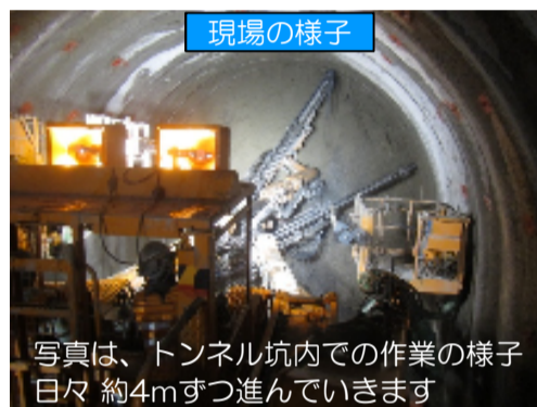
写真は、トンネル坑内での作業の様子 日々約4mずつ進んでいます