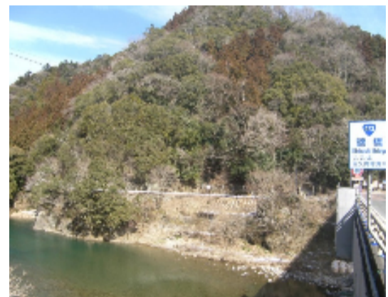
大千瀬川下流錦橋より左岸側を望む