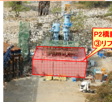
大千瀬川左岸より右岸を望む

進捗状況 P2橋脚の④リフト目の鉄筋型枠組立を行っています。また完成した③リフトを地中へ沈める作業を夜間に行なっています。