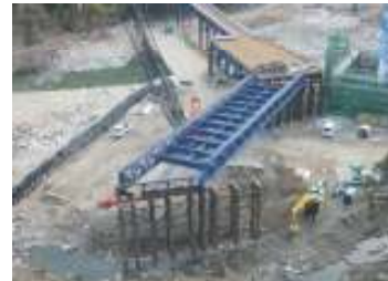
大千瀬川左岸より望む

進捗状況 工事が完了しました。施工期間中はご理解とご協力を頂き大変ありがとうございました。思い出の現場となりました。