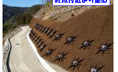
終点付近より望む