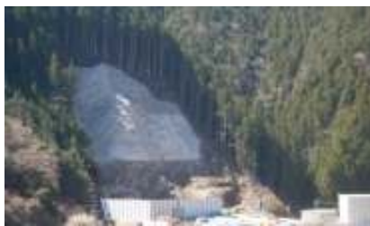
現場全景 大千瀬川対岸より撮影

進捗状況 皆様の御理解とご協力のおかげで、全ての作業を無事完了することができました。本当にありがとうございました。