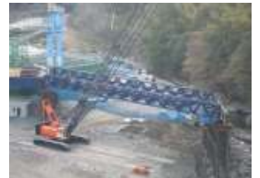
大千瀬川下流より望む