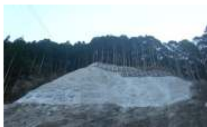
法面工事の施工完了