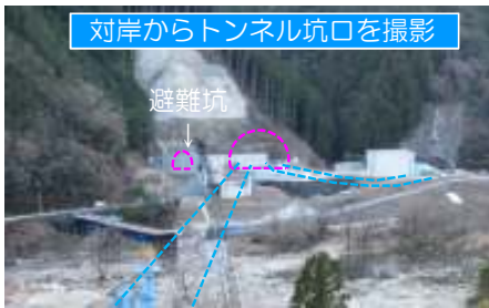
対岸からトンネル坑口を撮影

進捗状況 向かって左側の避難用トンネルの掘削を行っています。4月からは発破掘削を開始し、下旬からは昼夜間作業の予定です。安全第一で進めてまいります。ご協力よろしくお願ひします。