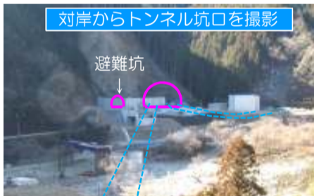
対岸からトンネル坑口を撮影

進捗状況 2月中旬から向かって左側の避難用トンネルの掘削を開始する予定です。掘削工事は昼間行います。安全第一で進めてまいりますのでご協力よろしくお願いいたします。