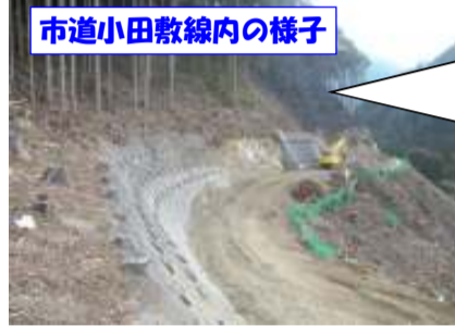
市道小田敷線内の様子