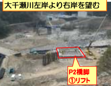
大千瀬川左岸より右岸を望む