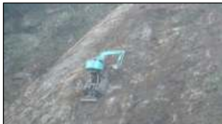
ロッククライミングマシン登坂走行中 機体をワイヤー2本で支えています