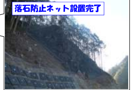
落石防止ネット設置完了