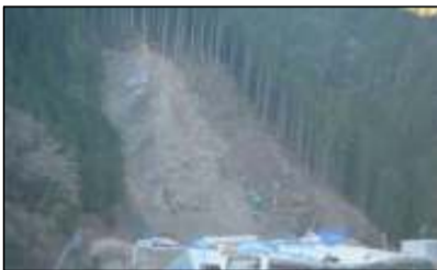
現場全景 大千瀬川対岸より撮影 法面工事対象箇所を除根・表土剥ぎが進みました