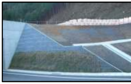
473号線沿いでの補強土壁が完了しました