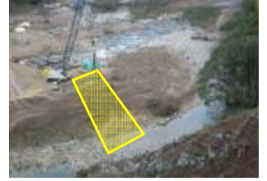
[着手前] 大千瀬川左岸より望む