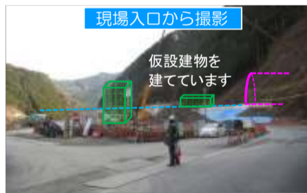
現場入口から撮影