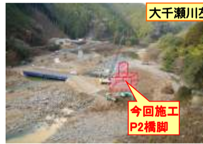
大千瀬川左岸より右岸を望む

進捗状況 大千瀬川を渡る渡河桟橋(工事用道路)、また施工箇所の伐採も完了し、当工事の施工ヤード整備に着手します。