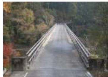
[完成] 小田敷橋 起点より望む

進捗状況 小田敷橋の車両防護柵が新しくなりました。現在仮橋の施工に向け、準備を行っています。