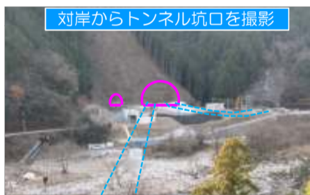
対岸からトンネル坑口を撮影

進捗状況 現在、防音壁や濁水処理フラントなどの仮設備の工事を行っています。引き続き、トンネル掘削の準備を進めていきます。