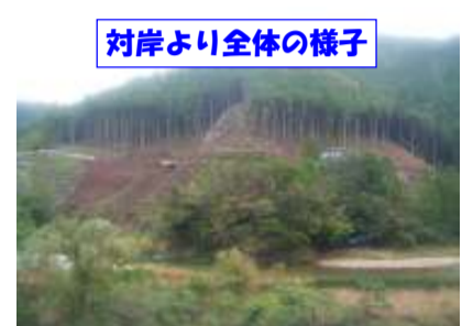
対岸より全体の様子