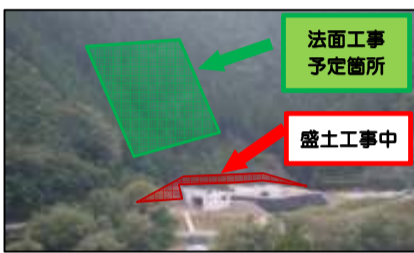
現場全景 大千瀬川対岸より撮影