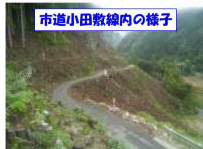
市道小田敷線内の様子