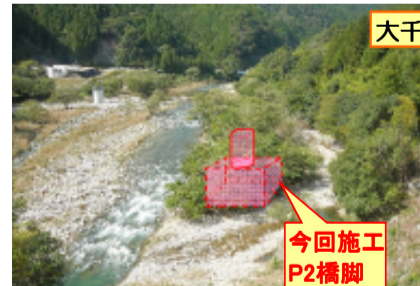
大千瀬川左岸より右岸を望む