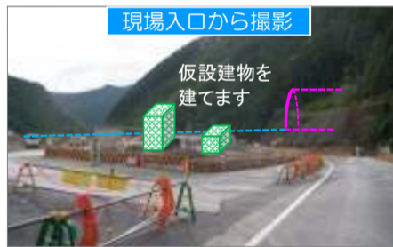
現場入口から撮影