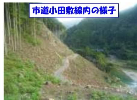
市道小田敷線内の様子