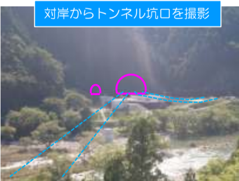
対岸からトンネル坑口を撮影