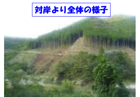
対岸より全体の様子