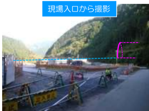
現場入口から撮影