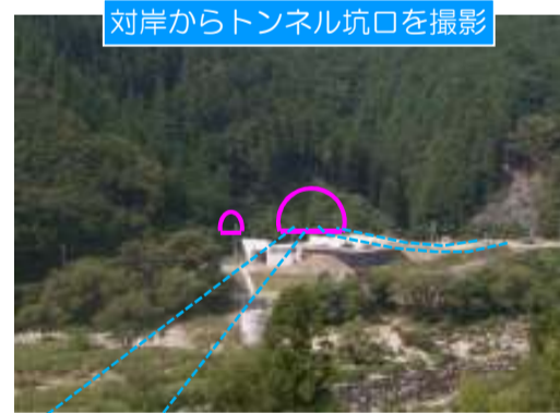
対岸からトンネル坑口を撮影