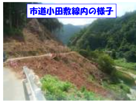
市道小田敷線内の様子

伐採木の集積と造材を行なっています。対岸より伐採した部分が確認できるようになりました。