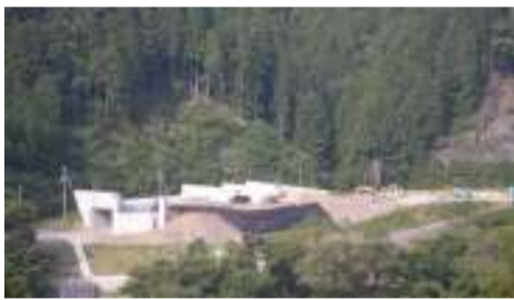
現場全景 大千瀬川対岸より撮影

国道473号付替えのための道路施設工事、ボックスカルバート周囲の盛土工事、舗装工事を行っています。