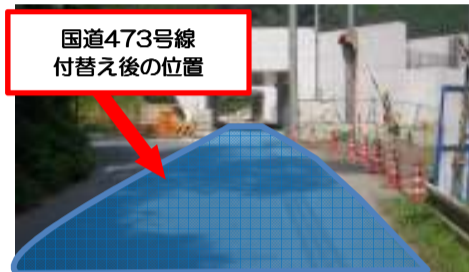
国道473号線 付替え後の位置