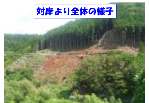
対岸より全体の様子