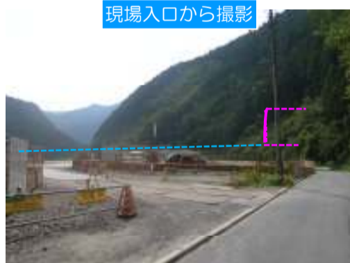
現場入口から撮影