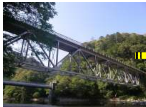
【足場設置完了】河川敷より望む