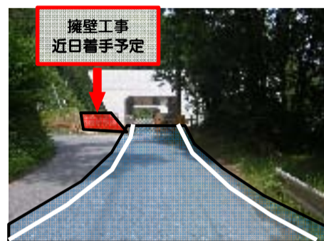
473号線道路付替箇所 錦橋側