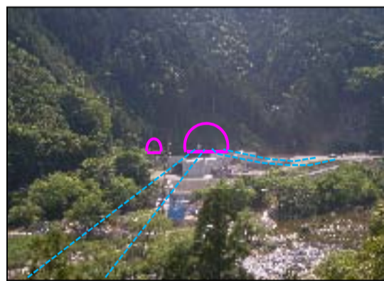
対岸からトンネル坑口を撮影