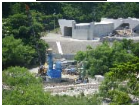
右岸側から見た状