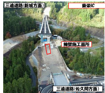
三遠道路(新城方面)