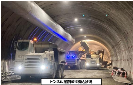
トンネル掘削ずり積込状況