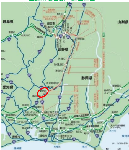
三遠南信自動車道位置図