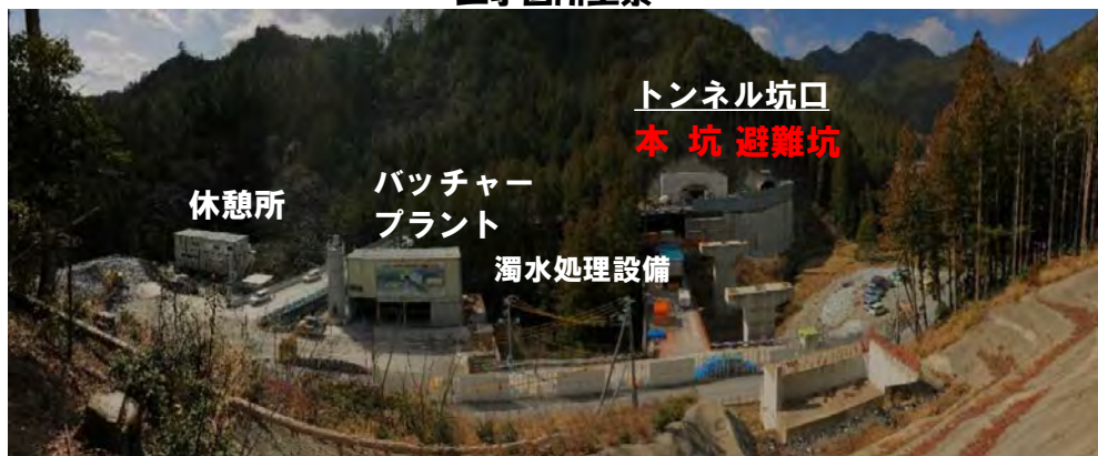
トンネル坑口 本坑 避難坑 休憩所 バッチャー プラント 濁水処理設備

4月からは屋のみの施工でトンネル工事を進めています。今月は本坑の掘削と覆工(ふっこう)コンクリートの作業と並行して避難連絡坑の覆工コンクリートの作業を行います。皆様のご意見を伺いながら進めてまいりますので、些細なことでもご相談ください。ご理解・ご協力のほどよろしくお願いいたします。