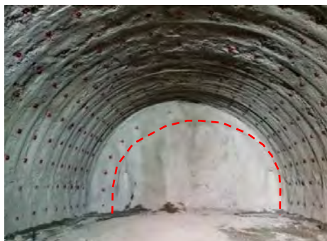
本坑工区境全景写真

引き続き、昼夜施工でトンネル工事を進めています。今月は新たに本坑の中央排水工事を避難連絡坑と本坑覆工(ふっこう)コンクリートの作業と並行して行います。皆様のご意見を伺いながら進めてまいりますので、些細なことでもご相談ください。ご理解・ご協力のほどよろしくお願いいたします。