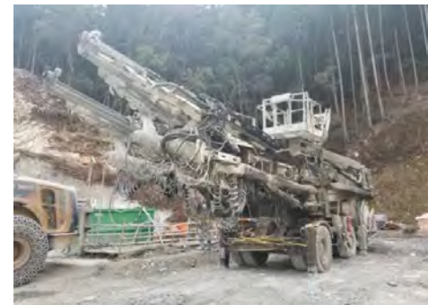
ドリルジャンボ全景写真

平成29年11月より着手した本坑のトンネル掘削が、平成31年3月13日をもって所定の深度に到達することができ、ようやく避難坑と本坑のトンネル掘削作業が完了しました。今後、対面工区(大林組)が赤の点線(左の写真)に沿って向い側から掘削し、全長約3.6kmのトンネルがつながります。右の写真は、ドリルジャンボの全景になります。約1年と4ヶ月の長い間トンネルの坑内で使用したため、吹付コンクリートのリバウンド(跳ね返り)や粉塵が付着し汚れたように見えます。この後はきれいに整備を行い、また別なトンネル現場で使用されていきます。