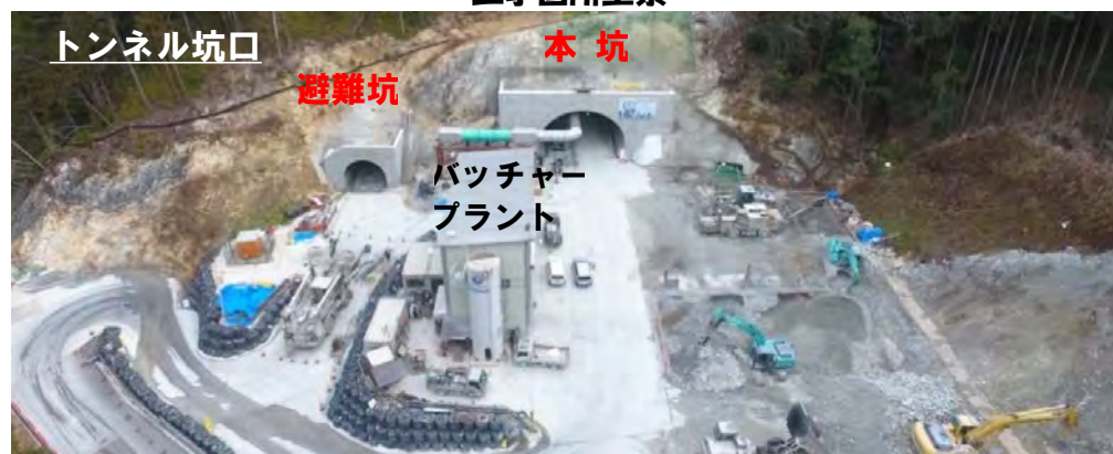
トンネル坑口 避難坑 本坑 バッチャー プラント

引き続き、昼夜施工でトンネル工事を進めています。今月は新たに本坑の中央排水工事を避難連絡坑と本坑覆工(ふっこう)コンクリートの作業と並行して行います。皆様のご意見を伺いながら進めてまいりますので、些細なことでもご相談ください。ご理解・ご協力のほどよろしくお願いいたします。