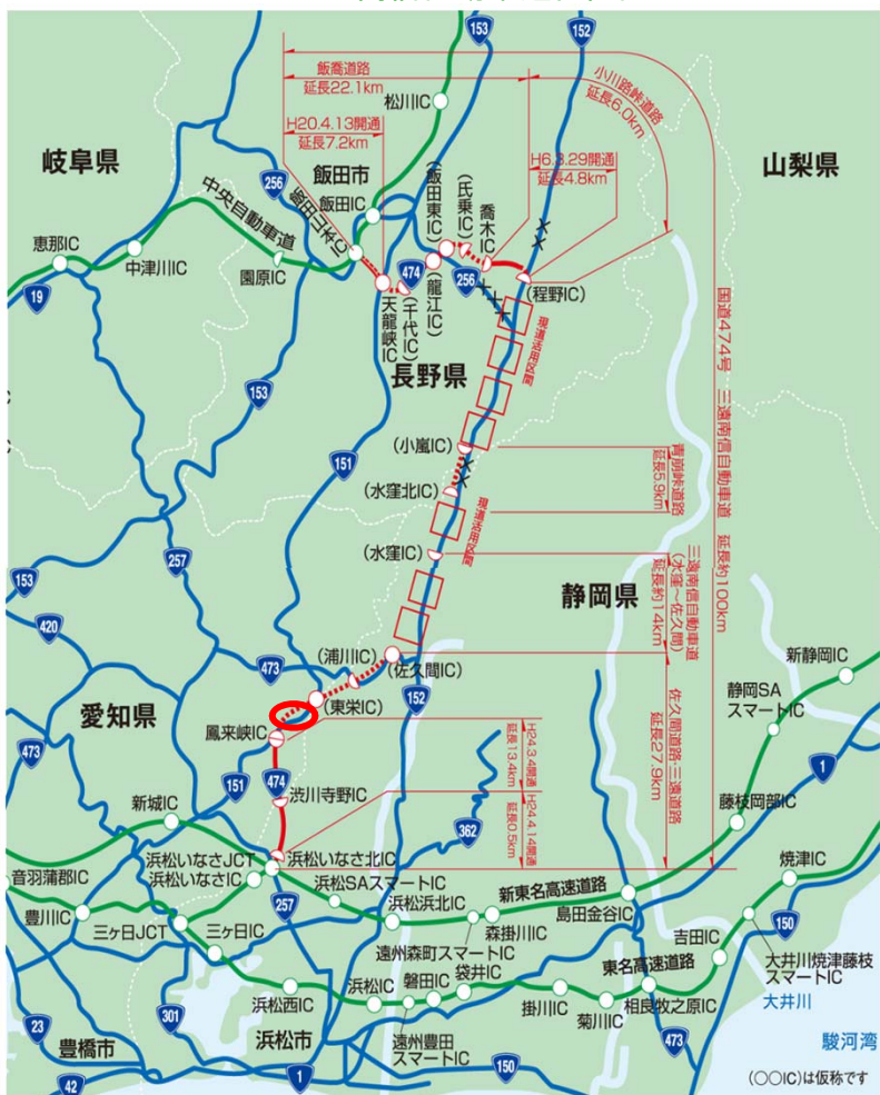
三遠南信自動車道位置図

左の写真は、本坑の覆工(ふっこう)コンクリート打設完了後、パネルを並べて養生している状況と、覆工(ふっこう)コンクリートへの透水を防ぐための防水シートを設置した全景になります。右の写真は、避難坑の先端部(切羽)の全景になります。右に向って掘ってある穴は本坑と避難坑をつなぐ連絡坑になります。この連絡坑は将来、本坑で緊急事態等が発生した際に、避難坑へ避難したり緊急車両が本坑へ出入りする際に使用します。