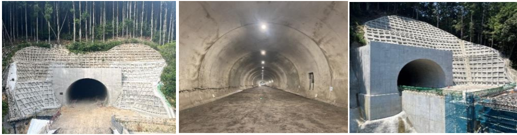
起点側坑口 (浜松市側)