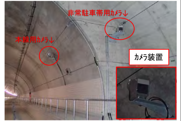
トンネル内カメラ