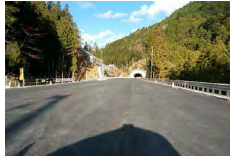
現場状況 ランプ部