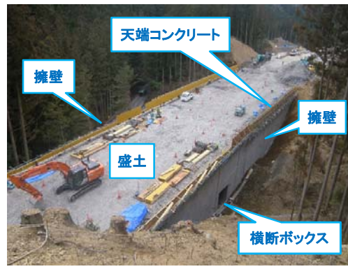
連絡路～オフランプ部