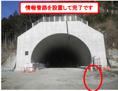
トンネル内工事完成しました