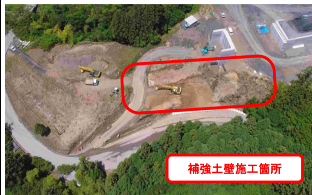
補強土壁施工箇所