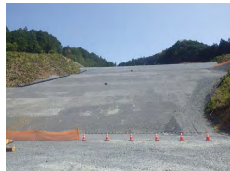
横見地区施工箇所