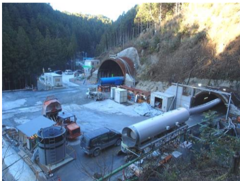
トンネル現場視察