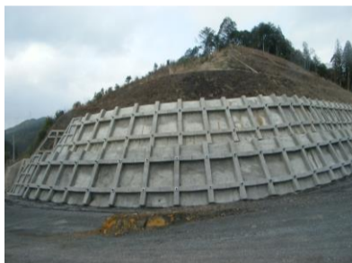
東栄IC部 作業箇所写真

進捗状況 工事は無事に完成致しました、長い期間工事にご協力頂き、ありがとうございました。