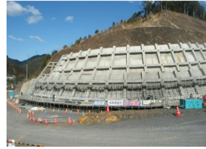
東栄IC部 作業箇所写真