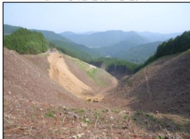
盛土予定地(横見地区)