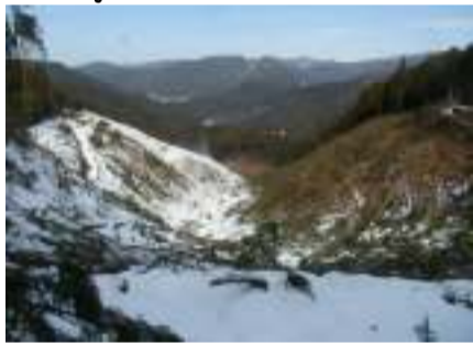
盛土予定箇所(横見)