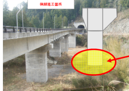
地盤改良施工箇所