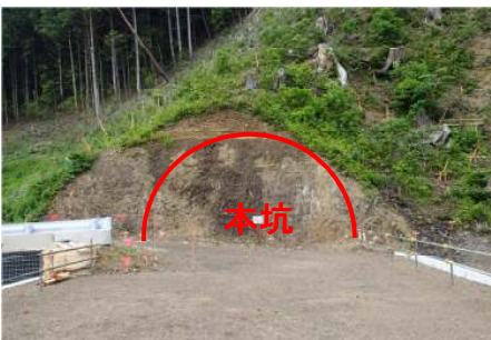
①トンネル坑口状況

進捗状況 トンネル掘削を行うための仮設備(吹付けフラントや濁水処理設備)の設置や測量などを行っています。