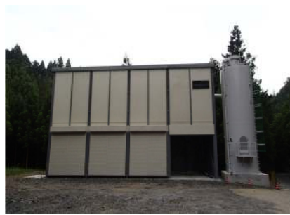
②吹付けフラント設置状況