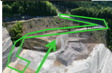
横見発生土受入地