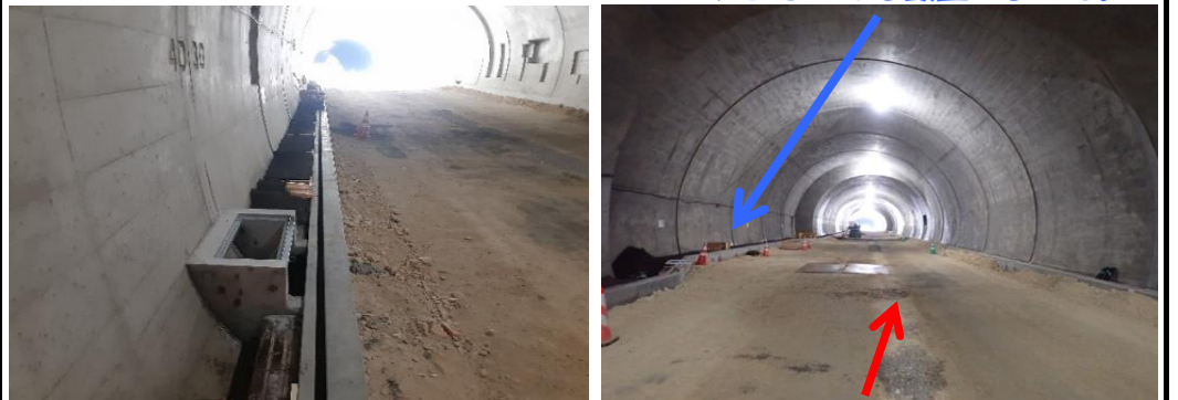
舗装の準備、上層路盤、中間層を行います。