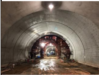
北側坑門工施工状況