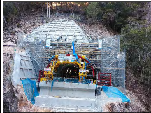
貫通側坑口 全景 坑門コンクリート打設状況