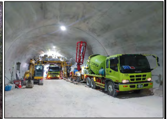
トンネル坑内 左の写真と同時間帯