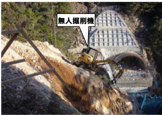
覆工コンクリート施工状況