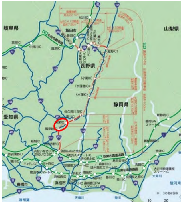
三遠南信自動車道位置図