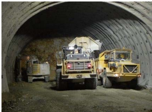
非常駐車帯区間 掘削状況