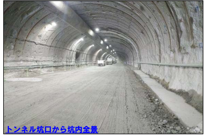
トンネル坑口から坑内全景