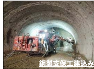
鋼製支保工建込み