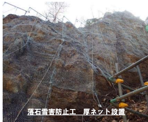
落石雪害防止工 厚ネット設置