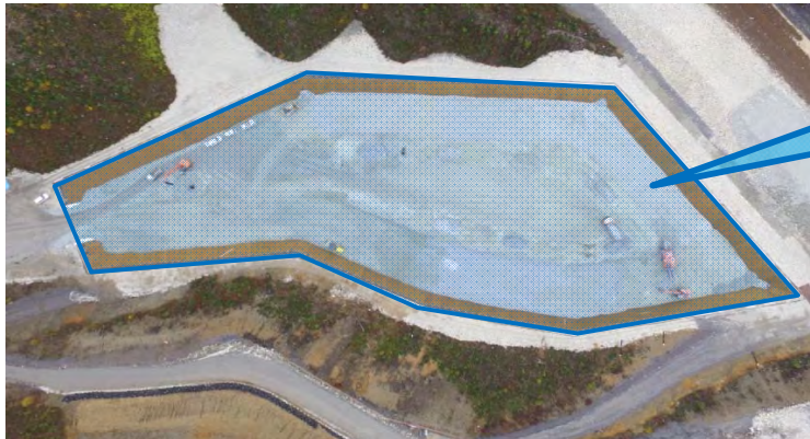
掘削土受取ヤード

新城川合地区・名号地区ともに仮設用道路が完成しました。先月に引き続き、吉沢地区にて佐久間・三遠道路トンネル工事の掘削土を受入、盛土する工事を行っています。