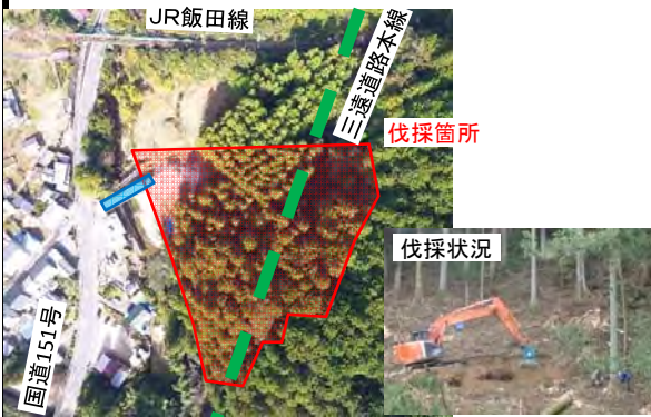
新城市川合浅井平地区