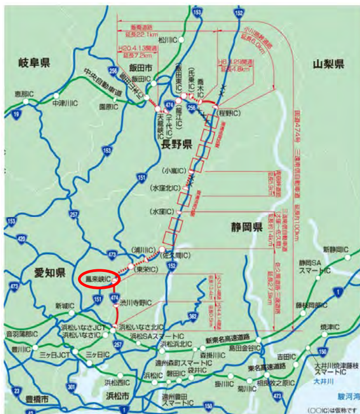
三遠南信自動車道位置図