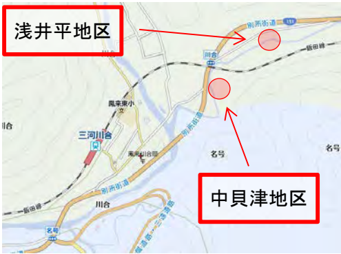
新城市川合中貝津地区