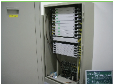
三遠トンネル主電気室光成端箱