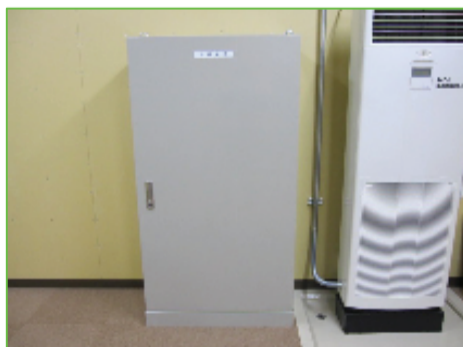
三遠トンネル副電気室光成端箱

7月26日無事竣工検査を迎える事が出来ました。無事故・無災害で工事を終了出来た事を嬉しく思います。工事へのご協力ありがとうございました。