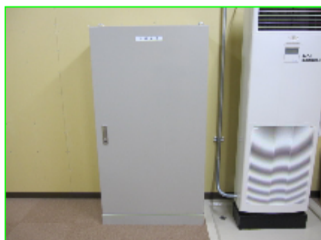
三遠トンネル副電気室光成端箱