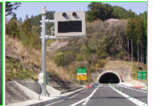
別所トンネル警報表示板

6月中旬より総合試験調整をいたします。 工事完成に向けて無事故・無災害により一層の努力に努めます。