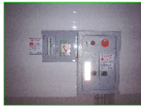
トンネル内非常警報設備