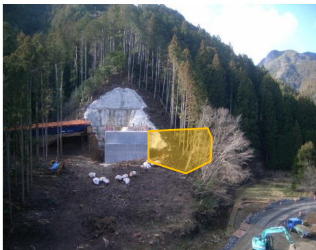
A1橋台奥のトンネル避難坑ヤードを施工します。