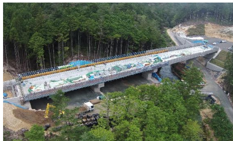
施工箇所(A1橋台より)