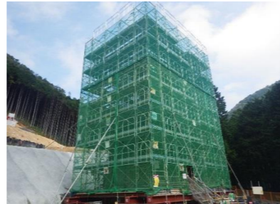
施工箇所(亀淵川工区)