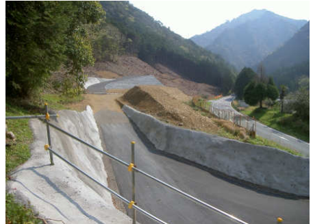
施工箇所(東から撮影)