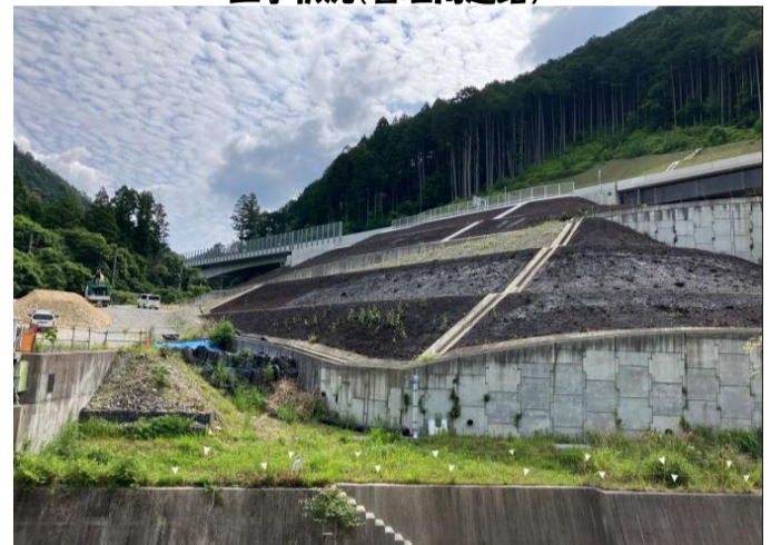
工事状況(管理用道路)

進捗状況 6月は、法面の客土吹付[管理用道路の整備]を行いました。 7月は引き続き、管理用道路の整備と工事用道路の撤去を行う予定です。