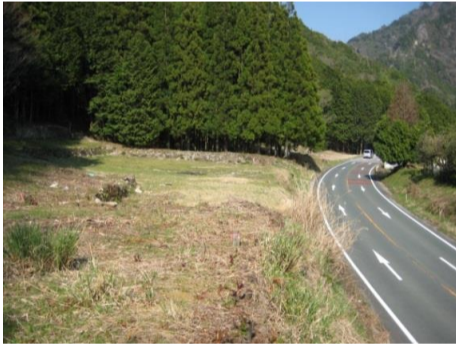
施工予定箇所全景