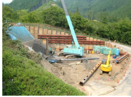
施工予定箇所写真(北から撮影)