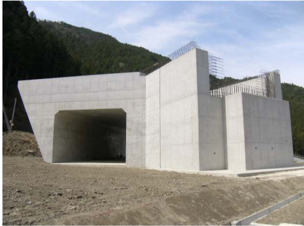
1号函渠およびA1橋台完成のようす

全ての工事を無事完了しました。沿線の皆様には長期にわたり、ご迷惑をおかけしましたが、おかげさまで、円滑に、無事故で工事を完了できました。ありがとうございました。