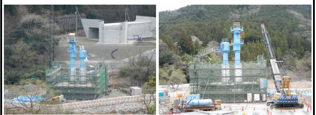
右岸側から見た状況