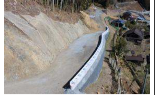
完成(No.0より終点を望む)

皆様のご理解ご協力を得て、工事を完成させる事が出来ました。長い間ありがとうございました。