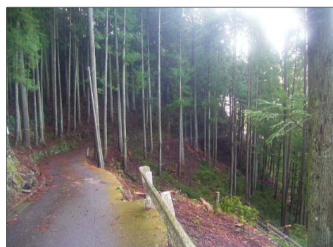
工区終点より起点方向を望む