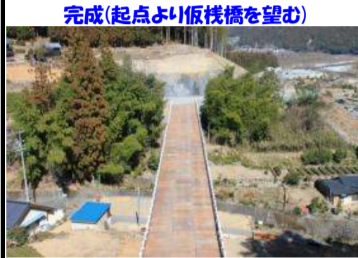
完成(起点より仮橋を望む)