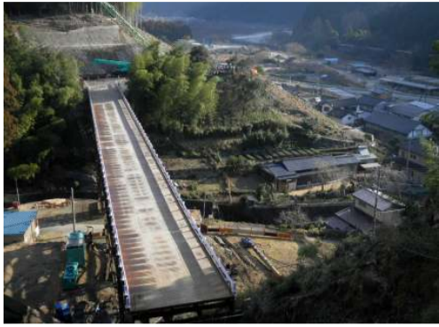
施工箇所写真(西から撮影)