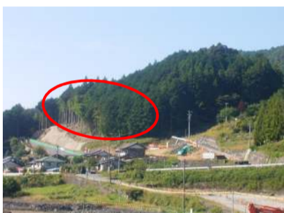
本線土工事・法面工事施工箇所