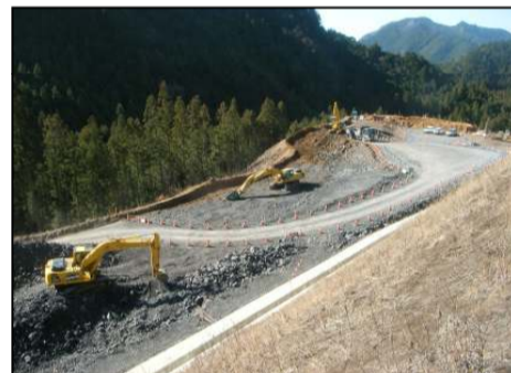
【掘削作業箇所(東栄IC部)】