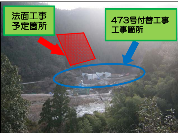
473号付替工事 工事箇所

3月末竣工予定の①H23佐久間道路浦川道路建設工事に続き、4月上旬より473号線付替工事に着手予定です。4月は工事ヤード内にて擁壁工事、盛土工事等を予定しています。安全第一で作業を進めていきますので、ご協力お願いいたします。