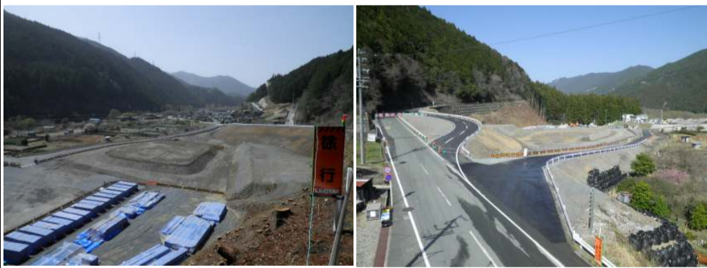
国道473号線迂回路部