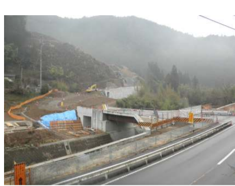
国道より連絡路を望む