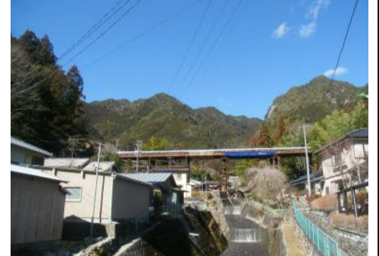
同左(白沢川下流より望む)