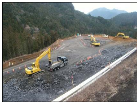
【掘削作業箇所(東栄IC部)】