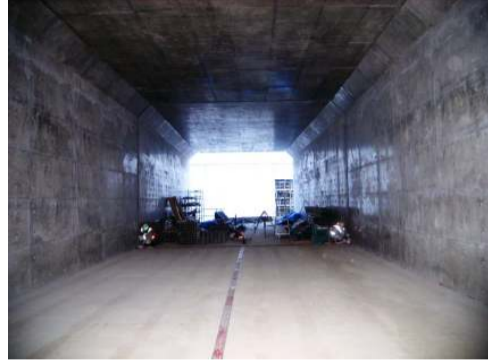
1号函渠内部 施工完了直後のようす