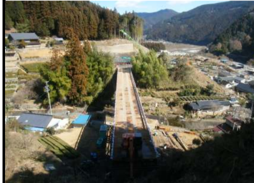
3月をもちまして工事が完成します。長い間ご理解ご協力の程ありがとうございました。