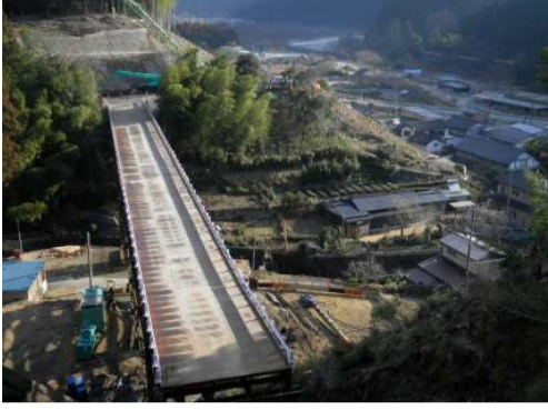
施工箇所写真(西から撮影)