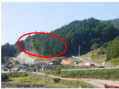
本線土工事・法面工事施工箇所