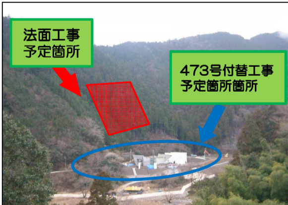
大千瀬川左岸側より工事箇所を撮影

現在施工中の①H23佐久間道路浦川道路建設工事に続き、4月より473号線付替工事に着手予定です。平面的に展開する道路工事、立体的な法面工事を含む工事です。環境配慮の上、安全かつ品質の良いものを作るための計画・準備を行って