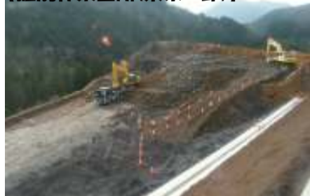
【掘削作業箇所(東栄IC部)】