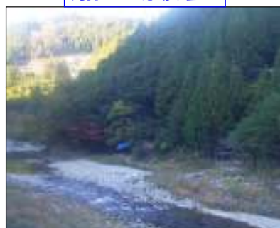
対岸より現場を望む