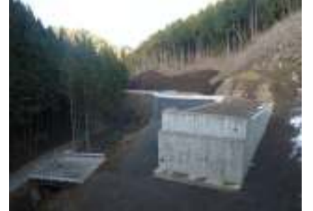
トンネル工事用道路も完了です

皆様のご理解とご協力のおかげで、工事を無事完了する事ができました。本当にありがとうございました。また、どこかでお会いできる事を楽しみにしております。