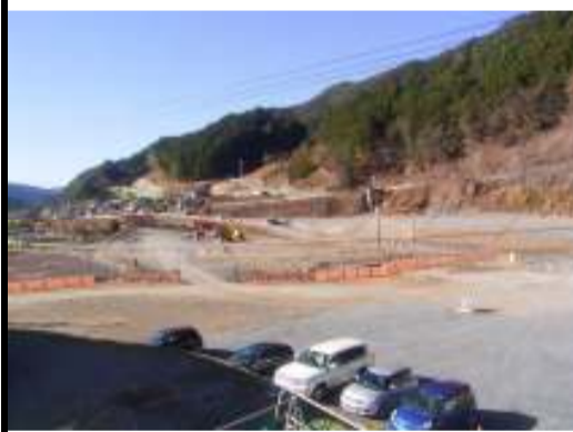
国道473号線迂回路部