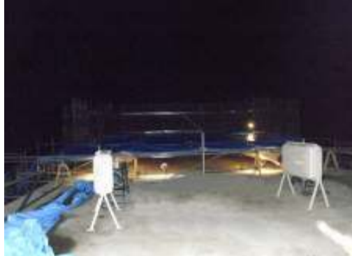
函渠頂版部 コンクリート養生 (ジェットヒーター養生)