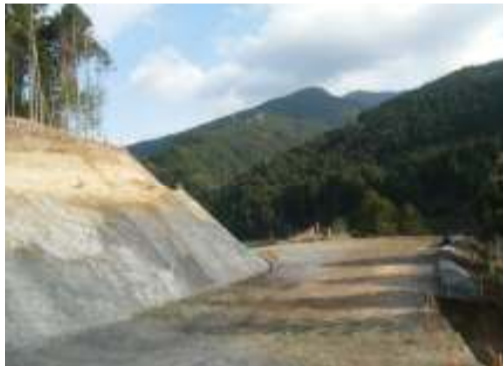
仮橋架設イメージ