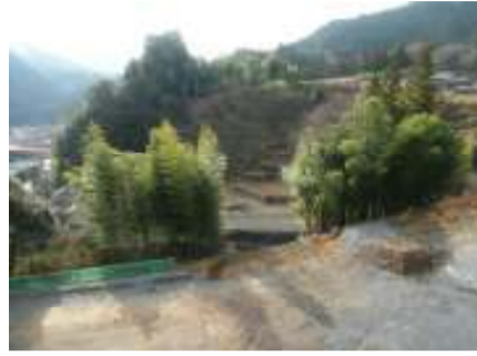
施工箇所写真(西から撮影)