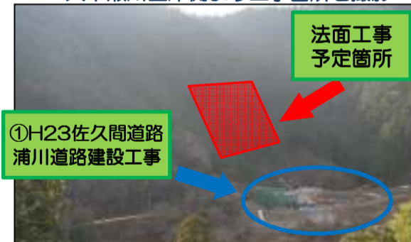
法面工事 予定箇所