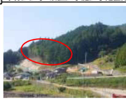
本線土工事・法面工事施工予定箇所