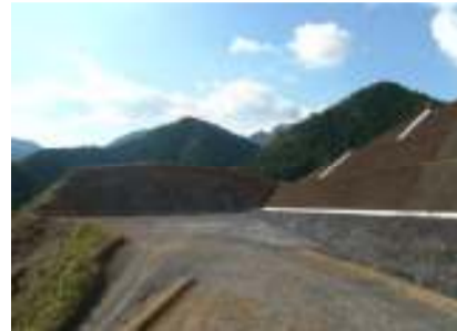
今回の施工分は完了しました

おかげさまをもちまして、本工事を無事に完了する事ができました。ありがとうございました。