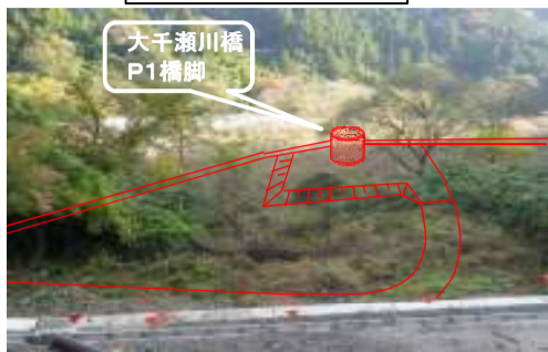
左岸側から見た現況