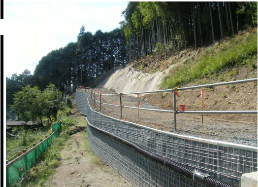
工事用道路を終点側より望む