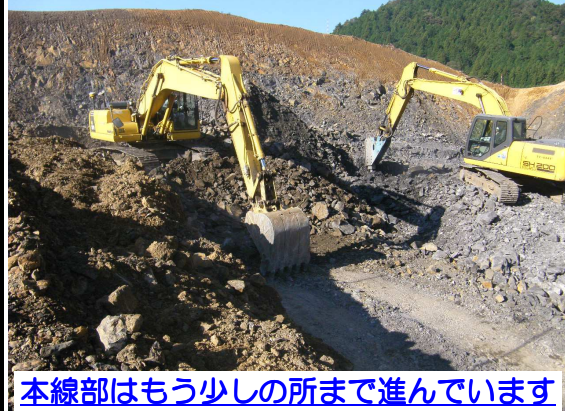
本線部はもう少しの所まで進んでいます

本線部の土砂掘削・運搬作業とともに、トンネル工事用仮設道路の仕上げを行っています。