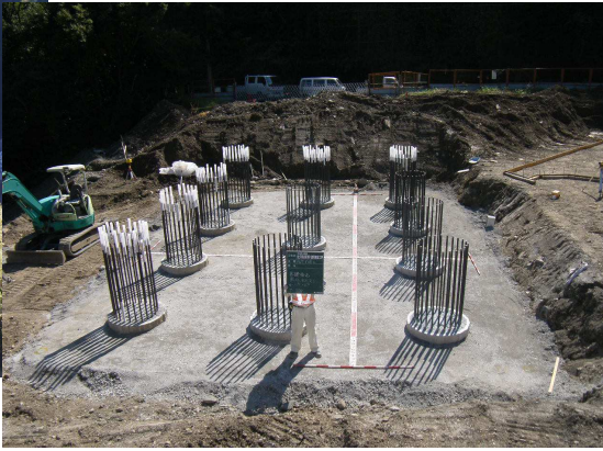
橋台基礎杭 施工完了全景