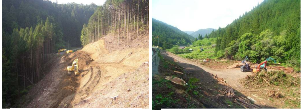
工事用道路の掘削を行っています

トンネル工事用仮設道路の掘削作業と残土処理地(足込地区)で伐採木の集積・搬出作業を行っています。