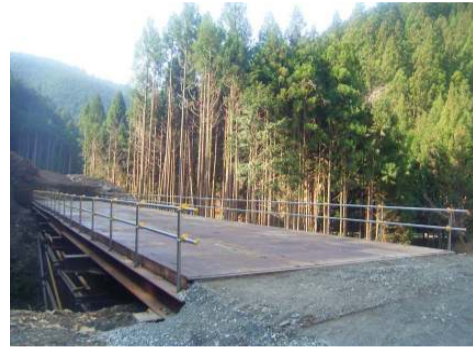
工事用道路の仮設栈橋

進捗状況 トンネル工事用仮設道路の仮設栈橋が完成しました。現在は、残土処理地(足込地区)の伐採作業を行っています。