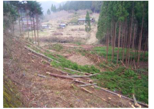
残土処理地(足込地区)の伐採状況

地域の皆様にご迷惑をお掛けしないよう、安全第一で作業を進めていきますので、ご理解・ご協力をお願いします。