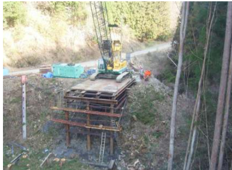
仮設栈橋を作っています。

地域の皆様にご迷惑をお掛けしないよう、安全第一で作業を進めてまいりますので、ご理解・ご協力をお願いします。