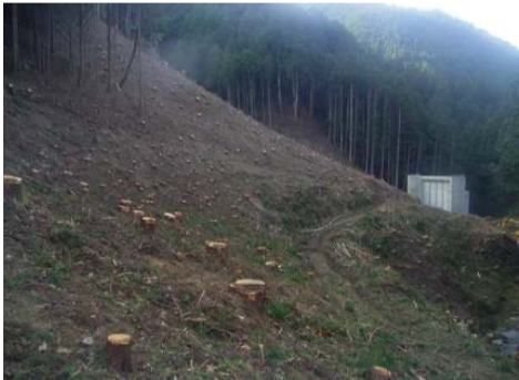
工事用道路の伐採作業が終了しました。