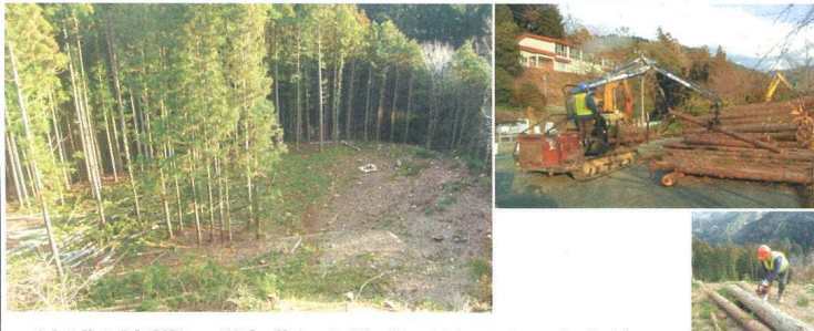
市原地区の伐採作業の様子です

地域の皆様にご迷惑をお掛けしないよう、安全第一で作業を進めていきますので、ご理解・ご協力をお願いします。