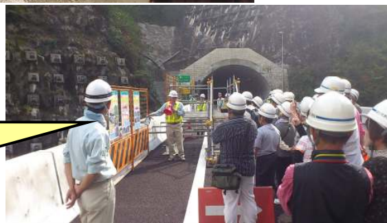
現場ガイドツアー 奥に見えるのが三遠トンネル (L=4,525m)です。