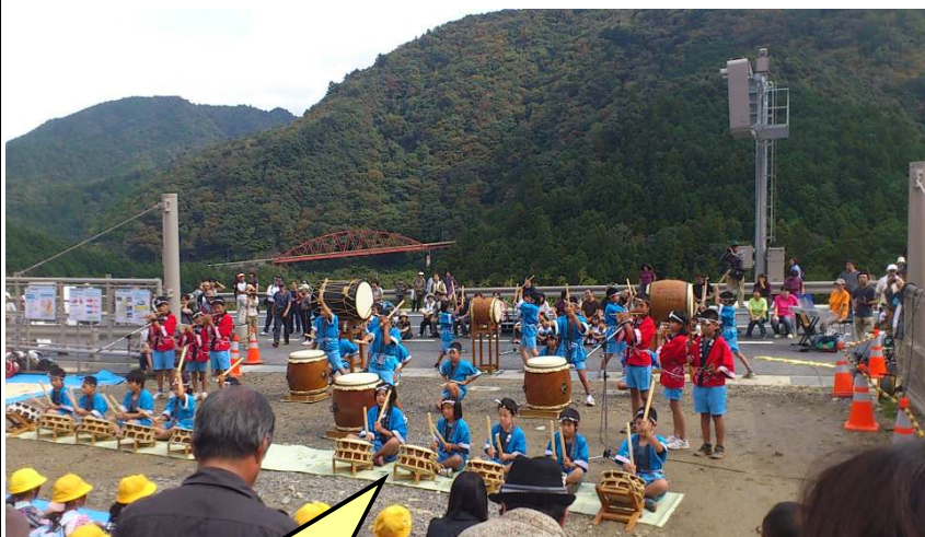
東栄小学校児童 和太鼓クラブによる演奏