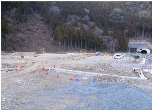
大島盛土防災施設スペース

開通を控え、引き続き本線付近の施設や連絡路の整備を進めてまいります。通行車両におきましては、安全運行を徹底いたしますので、ご理解の程よろしくお願ひします。