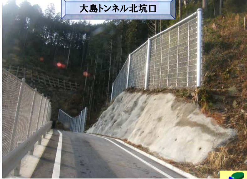
大島トンネル北坑口