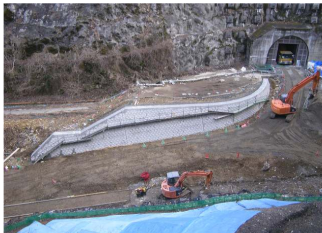
三遠トンネル避難坑口