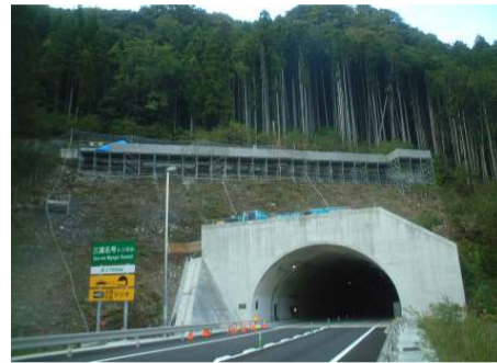
名号トンネル南坑口