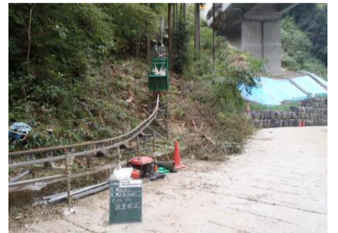
大島トンネル南坑口